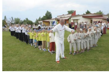
Hetked laulu- ja tantsupeolt