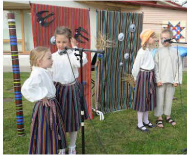
“Lava” taustal esinejad

Laulu- ja tantsupeo väljaku ääres kasvavad vanad ja jändrikud puud said samuti pidurüü – ümber puutüve sidusime kaltsuvaibad. Esinejate taustaks olid rahvusliku triibukangaga seinad, kus peal meie rahvuslik sümboolika.