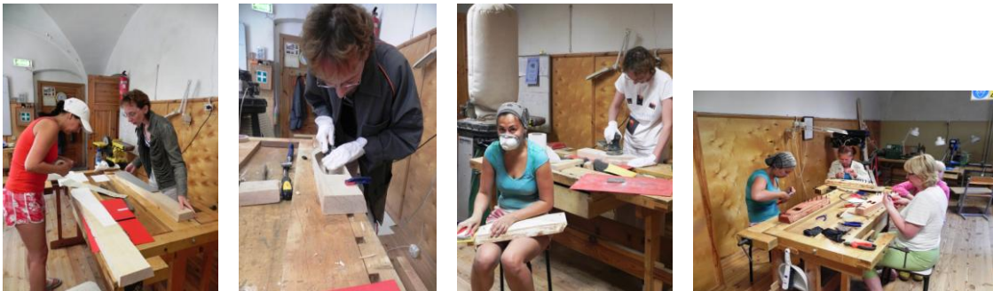
1. Puupakk, millest saab kord kannel!?!; 2. kandle sisemuse õñnestamine; 3. lihvimine; 4. keelte panek

2013.aasta kuulutati kultuuripärandi aastaks, mis andis veelgi pidulikkust ja sisukust juurde meie üritusele. Nimelt kavandasime nüüd igaks kuuks asutuse-sisene koolitusena töötoad: kahel korral kuus toimus käsitöö töötuba ning kahel korral kuus kandleõpetuse töötuba. Viimane sai teoks tänu aasta tagasi toimunud kandlemeisterdamise koolitusele, mille käigus viis töötajat valmistasid ise endale kandle: