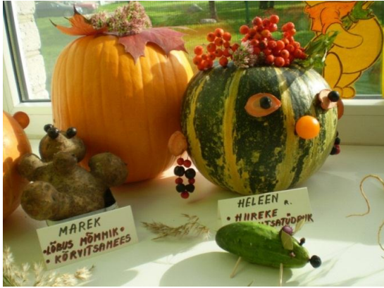
VAHVA KUJUGA KARTUL SAI NIMEKS