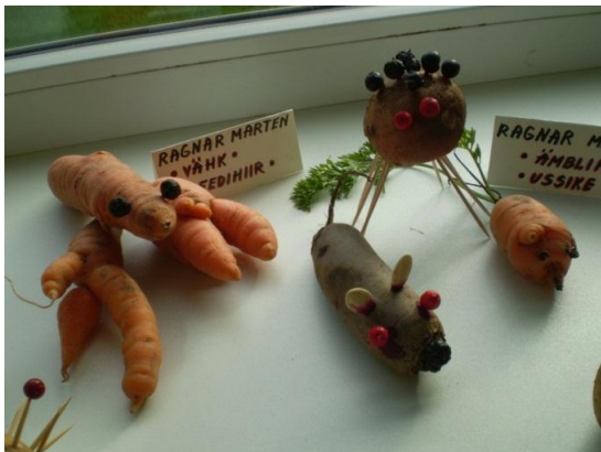
PORGANDITEST TULI TÕELINE VÄHK,

PEEDIST HIIR, PORGANDIST HIIR, KARTULIST ÄMBLIK.